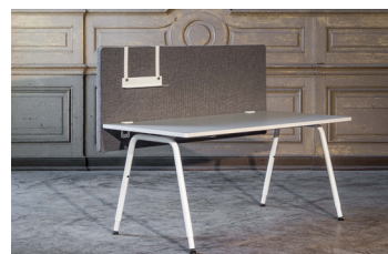
Hintertischelement mit Orgazubehör