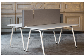
Tischaufsatzelement mit Orgazubehör